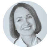
Von Dr. Silvia Kurpanik, Allgemeinmedizinerin, eedoctors.ch

Halten die Beschwerden an, kann der Kinderarzt Antibiotika verschreiben. Die meisten Mittelohrentzündungen heilen folgenlos ab.